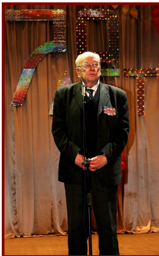
Фото 6. Выступление на юбилее школы. 2007 год.